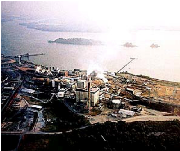
Hopewell, Virginie, USA

Exposition, de 1966 à 1975, des employés d'une usine de fabrication du chlordécone et des résidents à proximité de l'usine, à Hopewell (Virginie, USA).